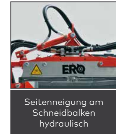
Seitenneigung am Schneidbalken hydraulisch