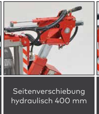
Seitenverschiebung hydraulisch 400 mm