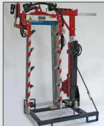
ERO-Laubschneider Modul Line einseitig Überzeilen auf Abstellvorrichtung (Option) mit hydraulischer Höhenver- stellung