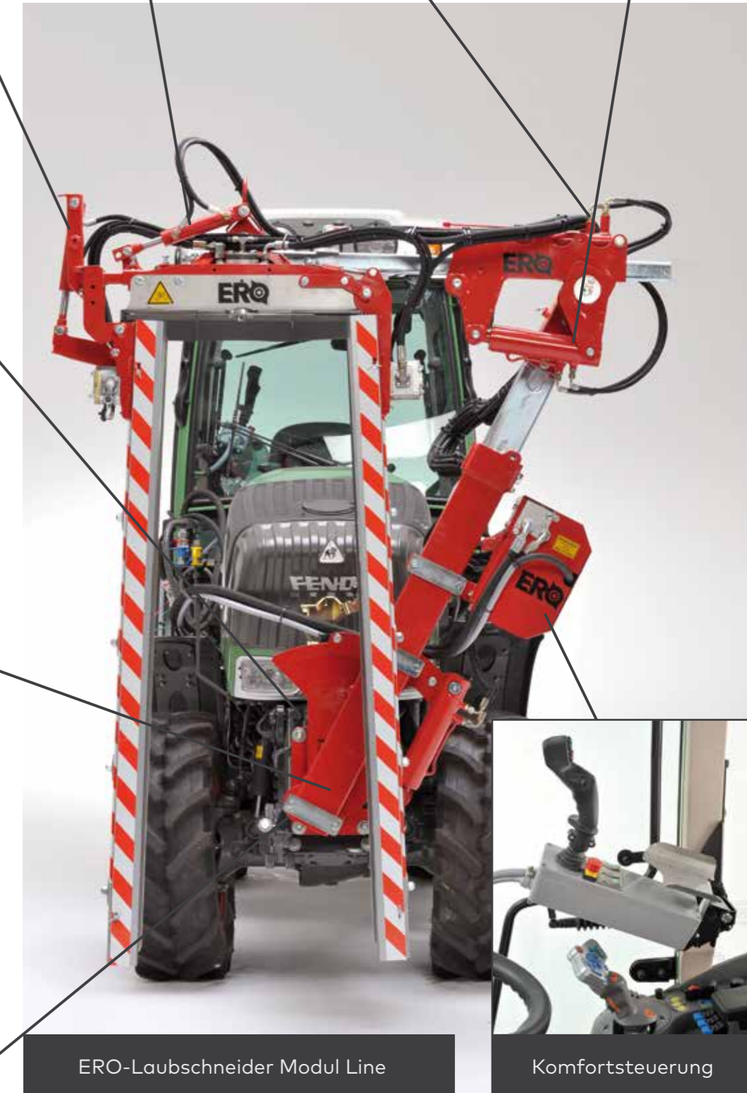
ERO-Laubschneider Modul Line