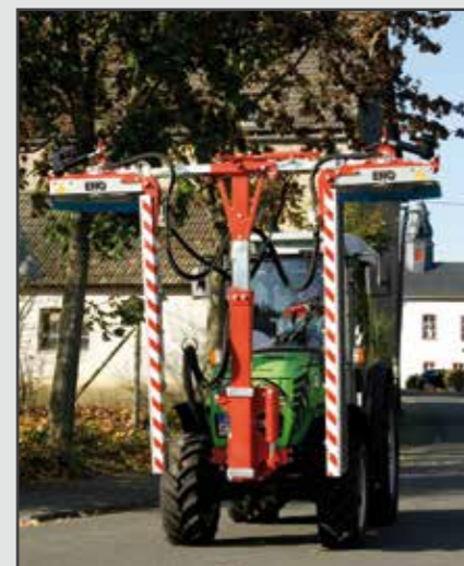
ERO-Laubschneider Modul Line zweiseitig L-Form