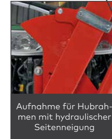
Aufnahme für Hubrahmen mit hydraulischer Seitenneigung